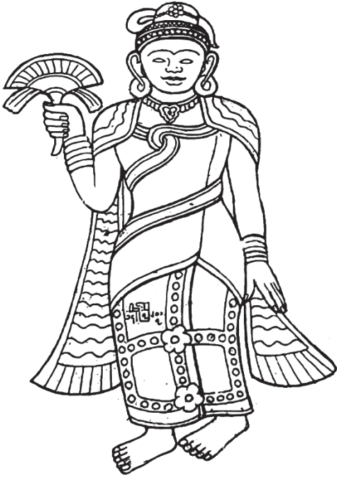
(ပုံ - ၂)

စလွယ်တော်ကို နှစ်ဆင့်ခံကာ စလွယ်တော်အောက်ဆင့်မှ နောက်ကျောသို့ ပတ်ထားကြောင်း တွေ့ရှိရပါသည်။ စလွယ်တော်၏အဆင့်တိုင်းတွင် ဖောင်းနှစ်လုံးကြား၌ ရွဲလုံးတန်းကလေးများဖြင့် အလှဆင်ထားသည်ကို တွေ့ရပါသည်။ လက်မောင်းနှစ်ဖက်စလုံး၌ ဖောင်းနှစ်ဆင့်ကြားတွင် ရွဲလုံးဖြင့် အလှဆင်ထားသော လက်ပတ်တစ်ကွင်းစီ ပတ်ထားပါသည်။ တံတောင်နှစ်ဖက်တွင် တဘက်စကို ခေါက်တင်ထားသည်ကို တွေ့ရပါသည်။ တံတောင်နှစ်ဖက်တွင်လည်း လက်ကောက်ကြီးတစ်ဖက် တစ်ပတ်ဝတ်ဆင်ထားကြောင်း တွေ့ရပါသေးသည်။ ခါးတွင် ဖောင်းနှစ်ဆင့်ကြား၌ ရွဲလုံးတန်းအလှဆင်ခါးပတ်ကို ပတ်ထားပါသည်။ ခါးပတ်ပေါ်မှ ရှေ့သို့ အဆင့်သုံးဆင့်ဖြင့် အလှဆင်ထားသော ဣန္ဒြေကာပြားကို ချထားပါသည်။ အပေါ်ဆုံးအဆင့်သည် အဝတ်တွန့်လိပ်နေဟန်ရှိပြီး အလယ်ဆင့်သည် အလယ်တွင် ပန်းပွင့်တစ်ပွင့်ပုံဖော်ထားသည့် ဖောင်းနှစ်လုံးကြား၌ ရွဲတန်းများဖြင့် အလှဆင်ထားဟန် ရှိပါသည်။ အောက်ဆုံးဆင့်မှာ ပိုမိုတင့်တယ်အောင် အလှဆင်ထားကြောင်း တွေ့ရပါသည်။ ပုဆိုး(ဒယော)ကိုမူ ခြေချင်းဝတ်ထိချ၍ဝတ်ထားဟန်ရှိပြီး အနားရစ်ငယ်များ ပါဝင်သည်ကို မြင်တွေ့နိုင်ပါသည်။