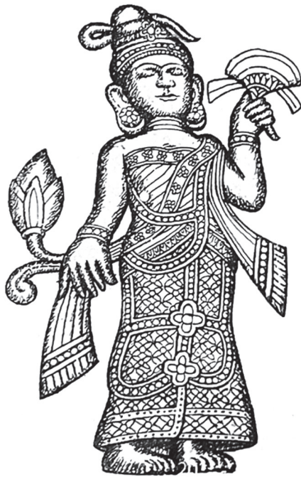
(ပုံ - ၄)

စလွယ်တော်ဆန်းပြားပုံမှာ ကြက်ခြေခတ်မဟုတ်ဘဲ အဆင့်နှစ်ဆင့် သွယ်ဝိုက်ချိတ်ဆက်ကာ အောက်ဆင့်ကို ကြိုးဖြင့်နောက်ကျောသို့ သိုင်းထားပြီး စလွယ်ပြားအောက်ရှိ ဖောင်းအောက်တွင် ပန်းလိပ်ပန်းညွန့်များနှင့် အားဖြည့်အလှဆင်ထားသည်။ ခါးတွင် ခါးပတ်ကြိုးနှစ်ဆင့်ပါရှိပြီး ခါးပတ်ကြိုးအောက်မှ အဆင့်သုံးဆင့်ဖြင့် အလှဆင်ဖန်တီးထားသော ဣန္ဒြေကာအပြားကြီးကို ရှေ့တွင် ချထားသည်။ ယင်းအဆင့်သုံးဆင့်ကို ဖောင်းလုံးကြား၌ ရွဲတန်းကျောက်မျက်ရတနာများ၊ ပန်းလိပ်ပန်းညွန့်များ၊ ပန်းပွင့်ကြီးများဖြင့် အလှဆင်ထားသည်။ ဘုရင်ဝတ်ဆင်သည့် ပုဆိုး (ဒယော) တွင် နှစ်ထပ်ပွင့်ဖတ်ဝန်းများ၊ ဖောင်းဆင့်များ၊ ပန်းလိပ်ပန်းညွန့်များဖြင့် တန်ဆာဆင်ထားပြီး ပုဆိုး (ဒယော) အောက်နားတွင် ကနုတ် ပန်းခက်ကြီးများဖြင့် အလှဆင်အနားသတ်ထားပါသည်။ ကိုယ်ရုံခြုံလွှာလွှားခြုံထားကြောင်းလည်း တွေ့ရှိရပါသည်။ ထို့ကြောင့် မင်းဗာဘုရင် ဟု ယူဆရသော ရခိုင်ဘုရင်ဝတ်ဆင်မှု ဒီဇိုင်းလက်ရာမှာ အနုစိတ်လက်ရာမြောက်လှပြီး မြောက်ဦးခေတ် တော်ဝင်ဘုရင်ဝတ်ဆင်ထုံးဖွဲ့မှုအတွက် စံပြုထိုက်သော လက်ရာကောင်းတစ်ခုပင် ဖြစ်ပါသည်။