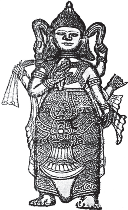
(ပုံ - ၃)

အင်္ကျီကို ဘယ်ဘက်တွင် ရင်ဖုံးထား၍ အင်္ကျီအောက်နားရစ်ကို အနားသတ်ဖောင်း ဖော်ကာ တင်ပါးဖုံးအောင် ဝတ်ဆင်ထားသည်။ ထဘီကို ဘယ်ဘက်သို့ဖုံး၍ ထဘီအောက်နား ရစ်ကို ဖောင်းရစ်ဖော်ကာ ဝတ်ဆင်ထားသည်။ ထဘီပေါ်တွင် ဖောင်းပြားဖော်၍ ရွဲတန်းများ၊ ပန်းပွင့်ကြီးများဖြင့် အလှဆင်ထားသည်။ ထဘီအောက်နားစကို ခြေချင်းဝတ်ဖုံးအောင် ဝတ်ဆင်ထားပါသည်။